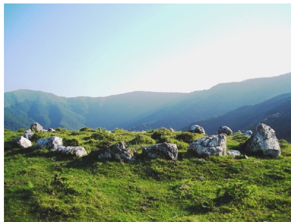
Crómlech en el collado de Urganata.

impresionante concentración de 25 cromlechs. La alambrada que separa Arano de Goizueta parte la estación. Varios de ellos se conservan muy bien, con grandes losas. La pista que sube a Leuneta-Unamene destruyó varios cromlechs. Hay un panel informativo en el lugar.