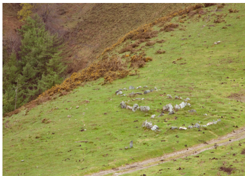
Errekalekuko multzo megalitikoa.

Punturik altuenera iristen garen eanean multzo megalitiko desberdinak ikusi ahal izango ditugu. Goizuetako lurretan aurkitzen gara dagoeneko. Bidea aurrera jarritu behar dugu Lekendiko gainara iritsi arte.